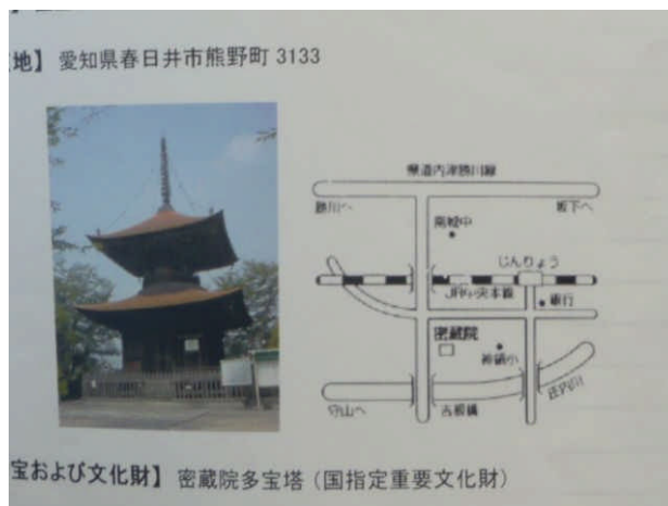
(9月16日(金)座禅例会会場の地図 蜜蔵院)