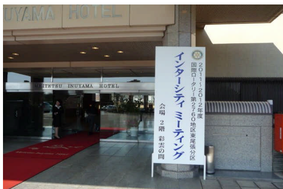
(名鉄犬山ホテル I M会場)