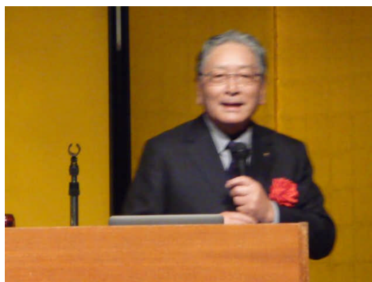
(基調講演 江崎バストガバナー)