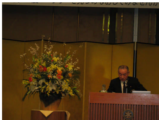
(松前ガバナー挨拶)