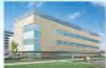
(仮称)総合保健センター ※イメージ図

例 会 日：金曜日 12:30~13:30 例 会 場：ホテルプラザ勝川 事 務 局：春日井市鳥居松5-45 T E L：(0568)81-8498 F A X：(0568)82-0265 E-mail：ksgi-rc@gaea.ocn.ne.jp