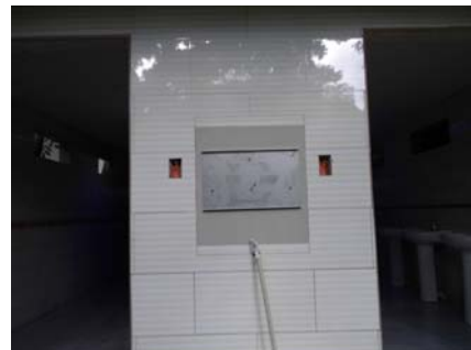
中央にプレートが入る