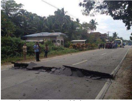
ボホール島での被害

この地震の余震を恐れて、学校はすべて閉校になりました。11月6日までとのこと です。閉校のためにあしながおじさんの選抜も、奨学金の支給もできませんでした。 今後の予定としては12月ごろの訪問を計画しています。