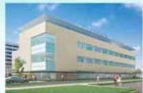
(仮称)総合保健センター ※イメージ図

例 会 日：金曜日 12:30~13:30 例 会 場：ホテルプラザ勝川 事 務 局：春日井市鳥居松5-45 T E L：(0568)81-8498 F A X：(0568)82-0265 E-mail：ksgi-rc@gaea.ocn.ne.jp