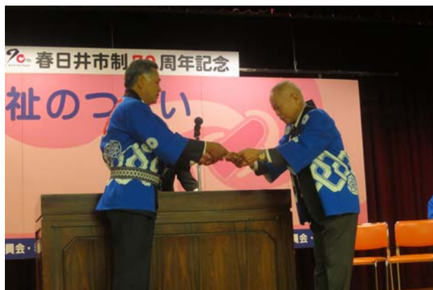
実行委員長へ助成金目録贈呈