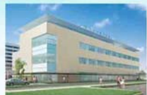
(仮称)総合保健センター ※イメージ図

例 会 日：金曜日 12:30~13:30 例 会 場：ホテルプラザ勝川 事 務 局：春日井市鳥居松5-45 T E L：(0568)81-8498 F A X：(0568)82-0265 E-mail：ksgi-rc@gaea.ocn.ne.jp