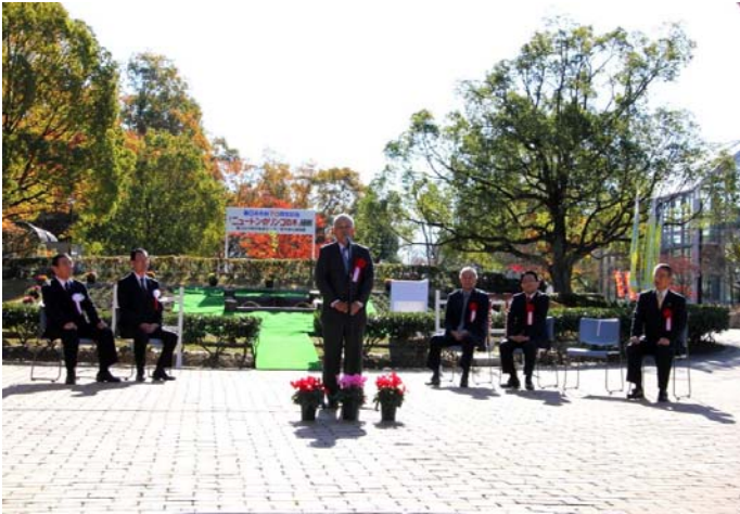
ニュートンのリンゴの木植樹式