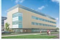
総合保健医療センター *イメージ

例 会 日：金曜日 12:30~13:30 例 会 場：ホテルプラザ勝川 事 務 局：春日井市鳥居松5-45 T E L：(0568)81-8498 F A X：(0568)82-0265 E - Mail：ksgi-rc@gaea.ocn.ne.jp