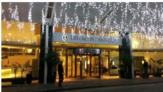
会場 インターコンチネンタルホテル