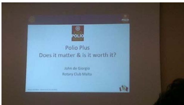
講演テーマ ポリオ撲滅への取り組み