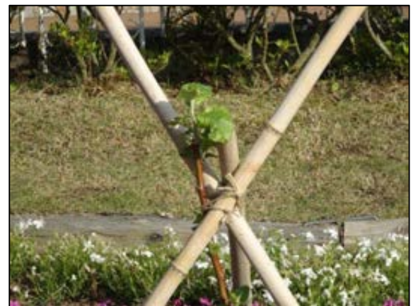
【ニュートンのリンゴの木】

昨年の11月に植樹した「ニュートンのリンゴの木」ですが、冬を越し、新しい葉が出てきていました。また、木の周りには花壇が作られていました。