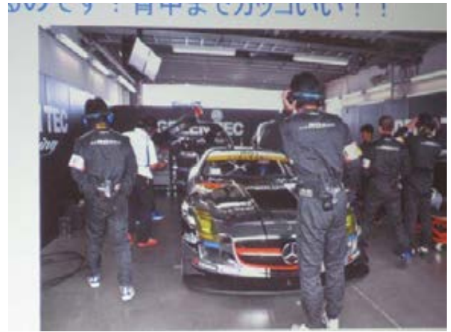
グリーンテック メルセデスベンツ SLSAMG GT3