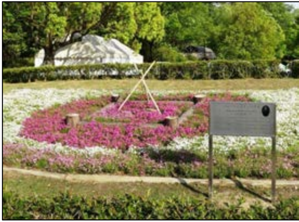
【 リンゴの木の周りの花壇 】