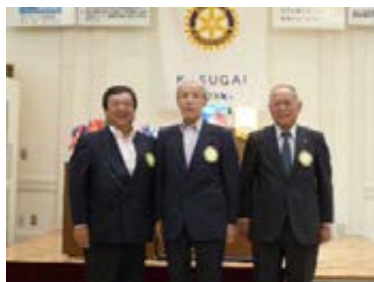
会員誕生の皆さん

個である会員の活動・行動が尊重され、その集積が集団としてのクラブ。故に集団としてのクラブの意思にもとづく行動は極力、抑える。