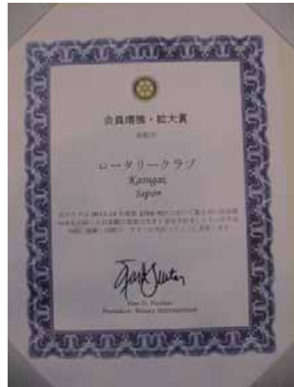
RI 会長賞 会員増強・拡大賞