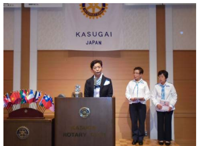
卓話 春日井ガールスカウト