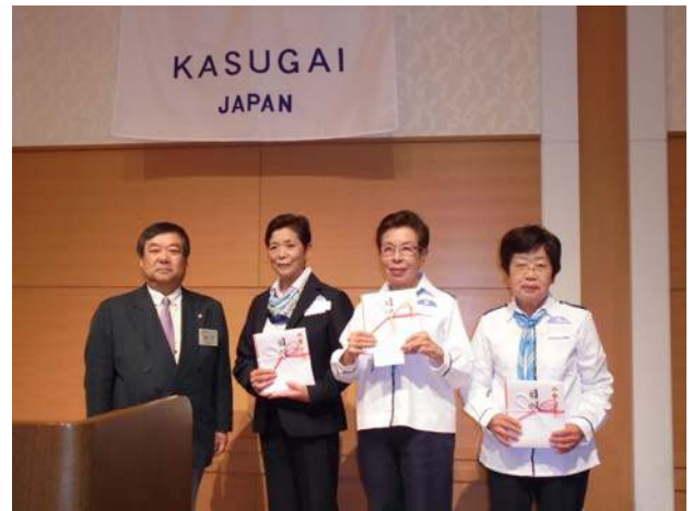
助成金授与 春日井ガールスカウト