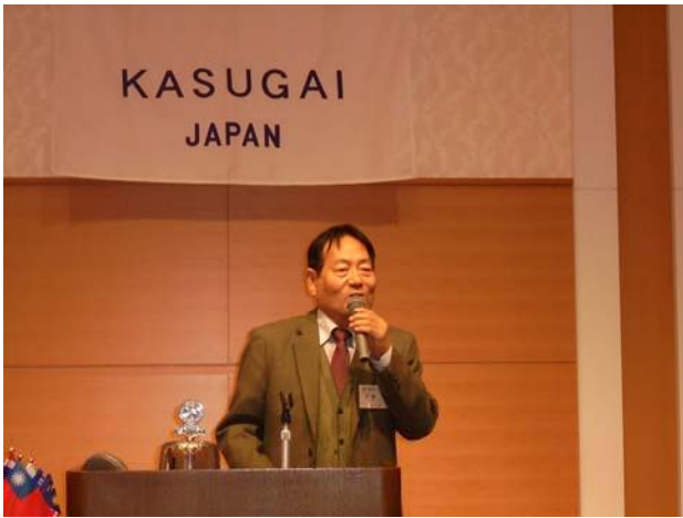
次期会長エレクト挨拶