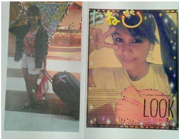
<日本へ行ってきまーす(冗談ですよ)>