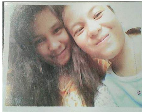
< 私↑ と 妹↑ >

<お昼休み>私はお昼の準備を親友のジェニー（11番の奨学生）としていました。そこで、どうして他の友だちはどうしてここにいないのだろうと不思議に思いました。そこで外に出てみると、ケンカをしていました。それを見たときは、何でそんなことしているのかわからなくて、ただ涙が流れるだけでした。それですぐ部屋に戻って、泣きながら待ちました。私は彼女達が部屋に戻ればケンカが終わると考えていましたが、違いました。彼女達は部屋に入っても叫び合っていました。私はもう耐えられない、と彼女達に叫び、「今日だけは」言い争いをやめてくれと言いました。すると、彼女達が笑っているので、おかしいなと思い、「なにが可笑しいの」と涙を浮かべながら聞きました。