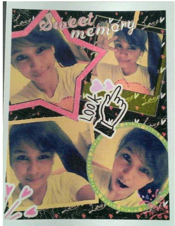
<フィリピン映画プロジェクトの後に>

私はパカシを勉強しなければなりません。でも心配しないで、明日の試験の後にたくさんお知らせします。全部試験と課題についてですよ。おやすみなさい。