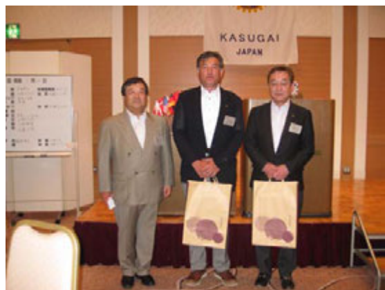
結婚記念日お祝い