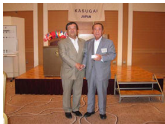
アテンダンス表彰