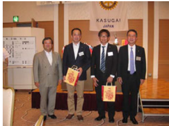
会員誕生日お祝い