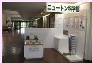
ニュートン科学館

例 会 日 : 金曜日 12:30～13:30 例 会 場 : ホテルプラザ勝川 事 務 局 : 春日井市鳥居松町 5-45 T E L : (0568) 81-8498 F A X : (0568) 82-0265 E - mail : Ksgi-rc@gaea.ocn.ne.jp