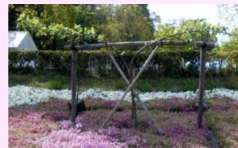
ニュートンのリンゴの木