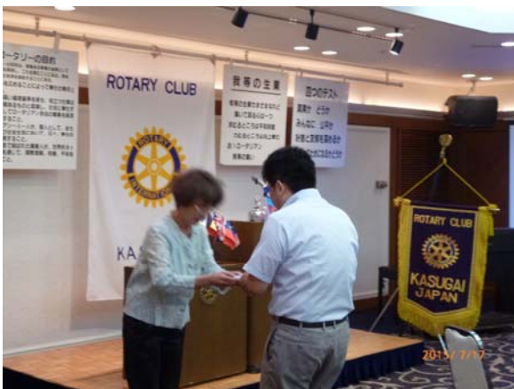
アテンダンス表彰