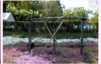
ニュートンのリンゴの木