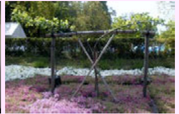
ニュートンのリンゴの木