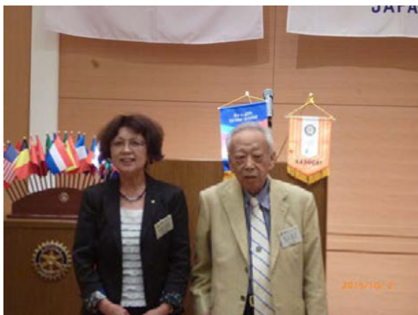
地区補助金事業 交通安全教室 平成 27 年 10 月 5 日 場所 春日井高校