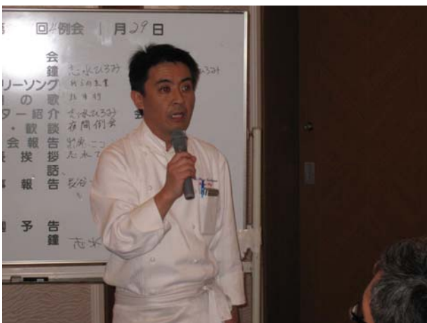
大鹿シェフ 料理紹介