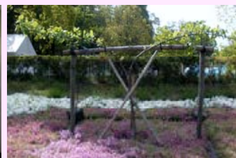
ニュートンのリンゴの木