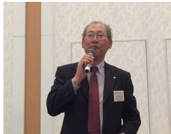
会員誕生日お祝い