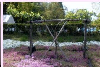
ニュートンのリンゴの木