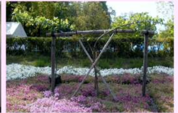
ニュートンのリンゴの木