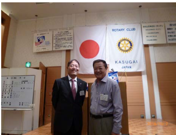
アテンダンス表彰

われら日本のロータリアン われら日本のロータリアン 一つの仕事をする時も 真心こめて考える これは誠か真実か