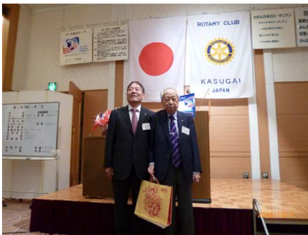
会員誕生のお祝い