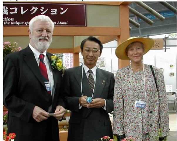
2002年5月 マクレディ4世夫妻と (4th 国際バラとガーデニングショーにて)

新型コロナウイルスに対しては引き続き、慎重な行動と、辛抱強い対応で収束を待ちたいと思います。頑張りましょう。