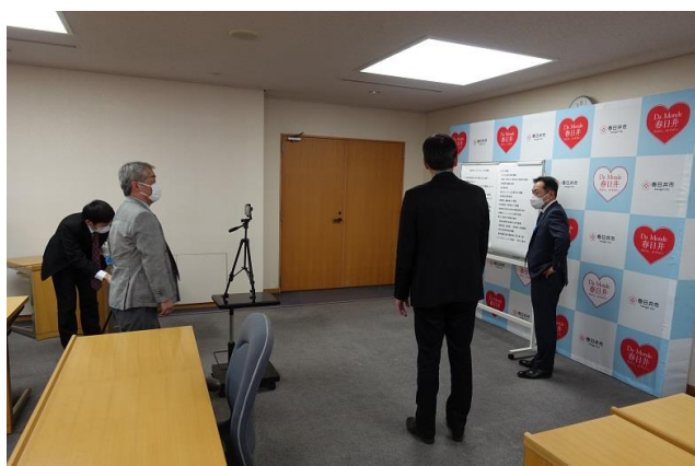
動画撮影の準備作業