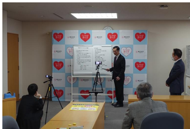
春日井市長の卓話の撮影風景