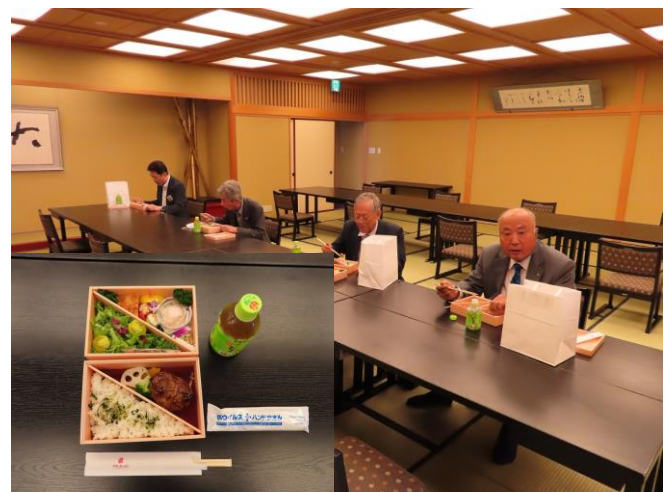
お弁当・昼食会場