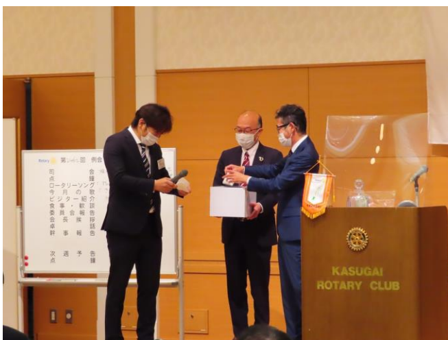
クリスマス抽選会