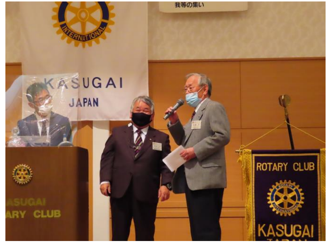
クリスマス抽選会 特賞