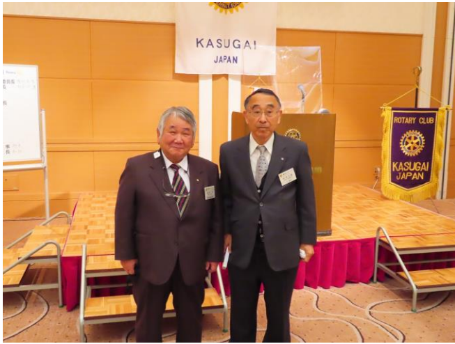
アテンダンス表彰