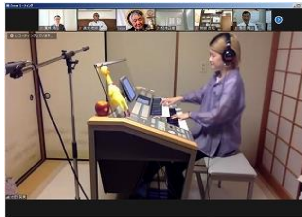
今月の歌、ロータリーソング、祝福 エレクトーン演奏