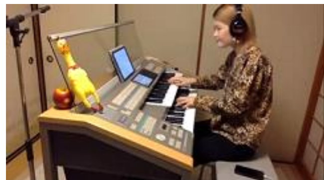
国歌、ロータリーソング演奏