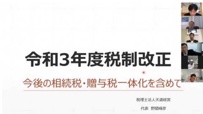
卓話 野間 峰彦君