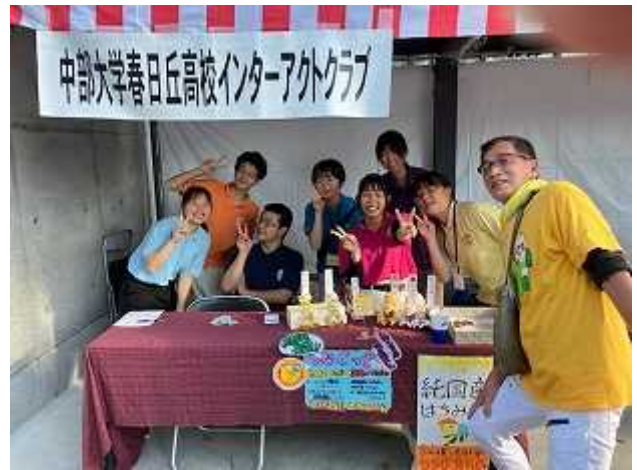
春日丘インターアクトクラブのブースクラブ (10月15日)