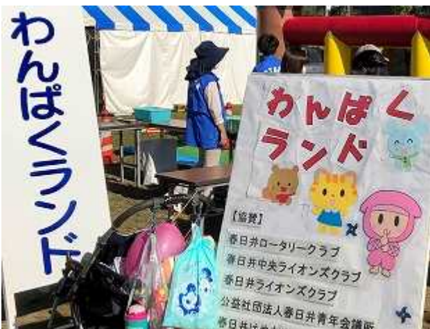
春日井 RC が協賛した「こども広場」の 『わんぱくランド』 (10月15日)