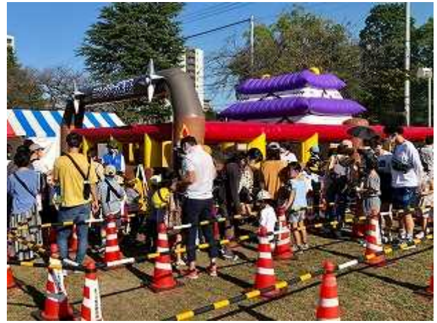
今年のアトラクションは『ニンジャ迷路』 (10月15日)