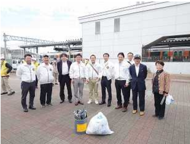
ポイ捨てふん害防止啓発活動 (10月13日)