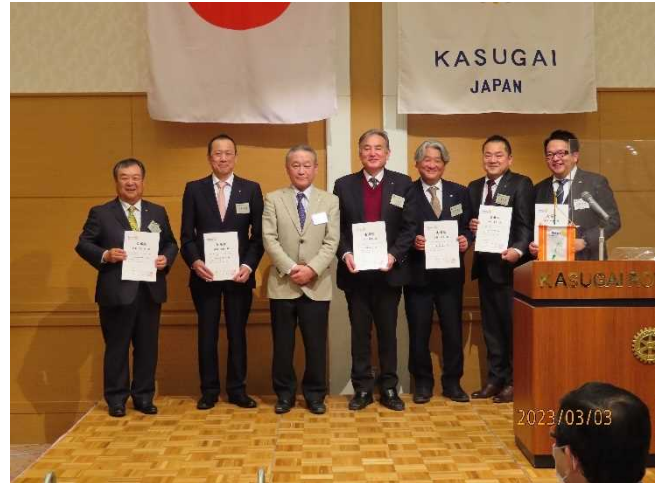
次年度地区出向の皆様