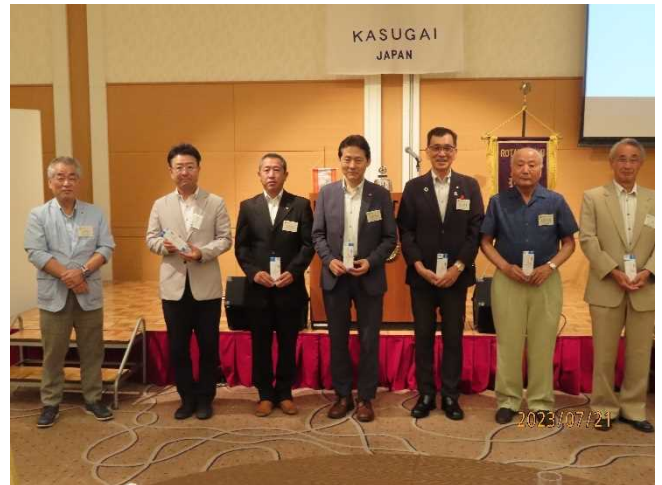
祝福 アテンダンス表彰