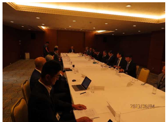
第2回クラブ協議会