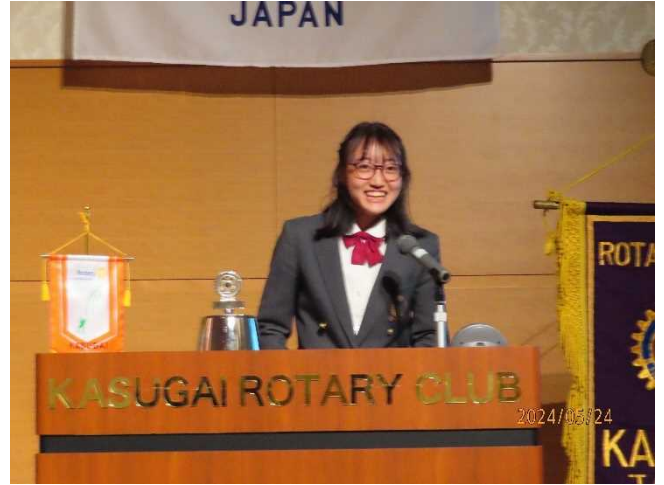
中部大学春日丘高校 I A C の活動報告