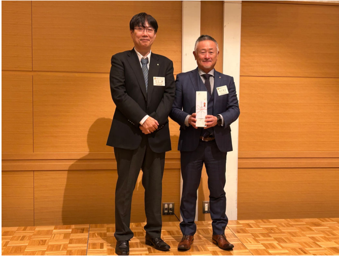
アテンダンス表彰