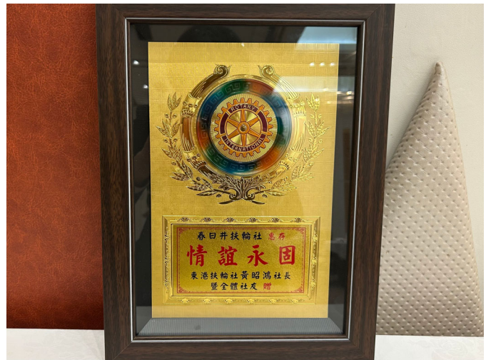
台湾東港ロータリークラブ 記念盾