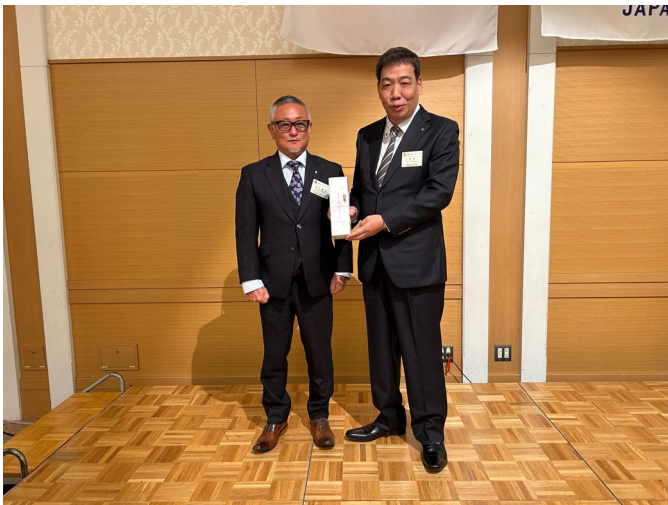
アテンダンス表彰