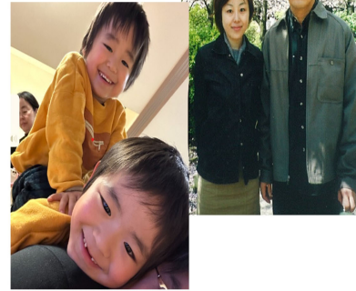
妻と子ども(長男7歳 次男5歳)