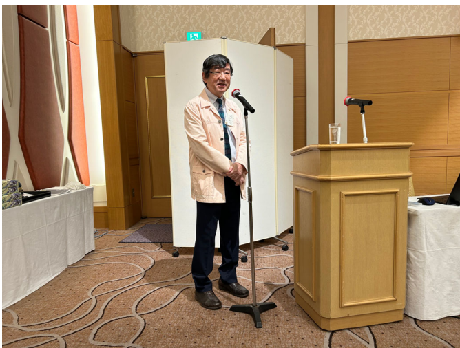
ロータリー活動に対し寄せられた感謝の言葉