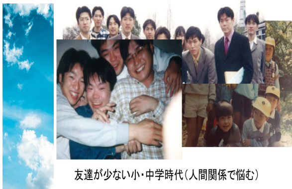
友達が少ない小・中学時代(人間関係で悩む) ▶人間関係に対する強い関心