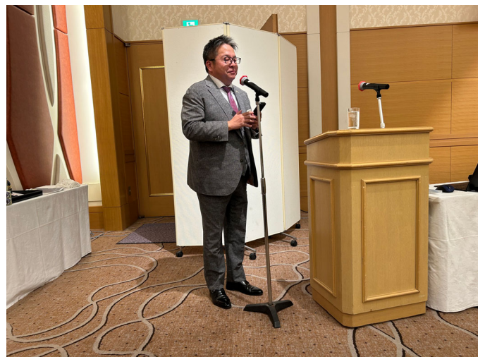
ロータリー活動に対し寄せられた感謝の言葉